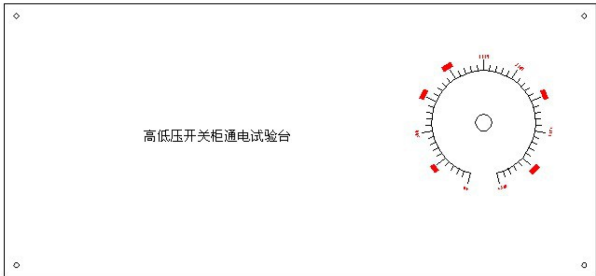
前面板示意图（图二）